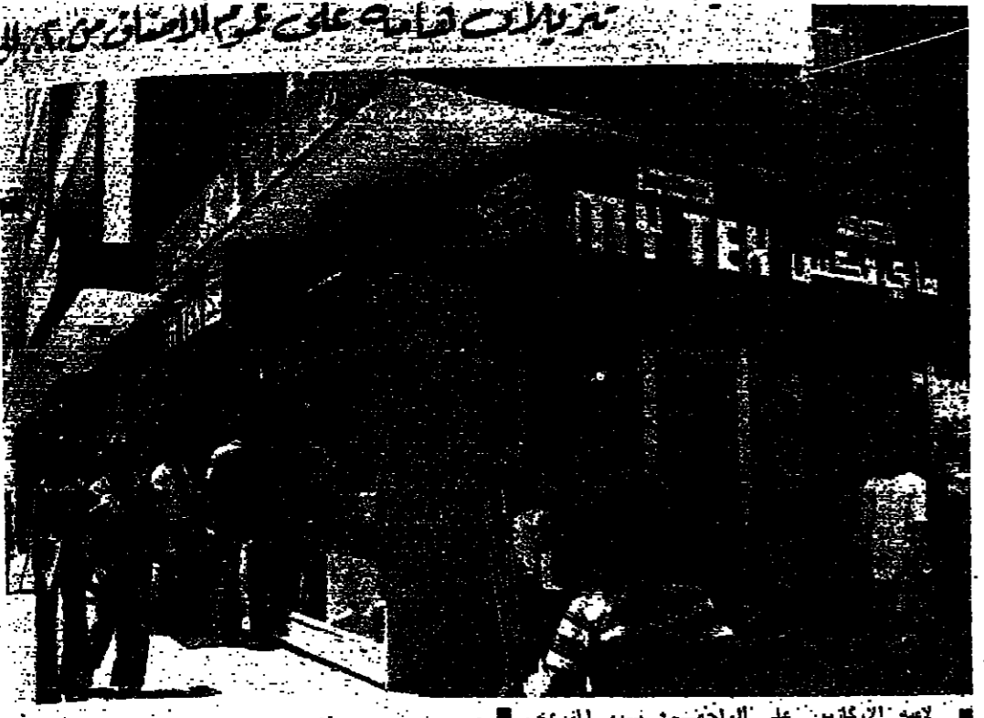
لاصه الإكازيون على الولحظة في سوق المزرعة